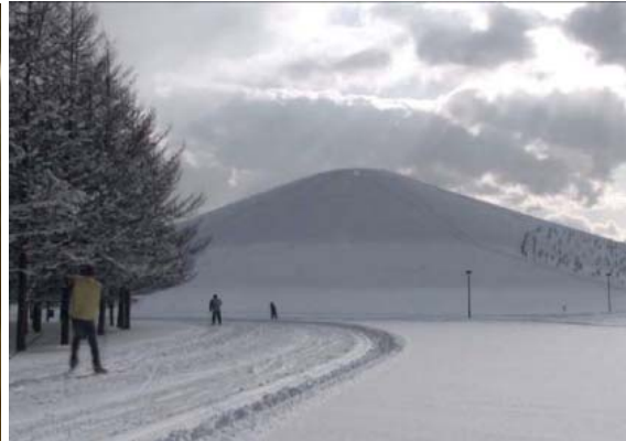
左: 鄭智禮、 Stiffen Water 、2009